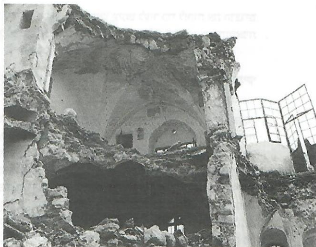
בית כנסת אברהם אבינו בחורבנו

"מי יתן ומעז ייצא מתוק, והמצב החדש יעורר את עם ישראל להכיר את חברון. אנו מצדנו נברך על כל הזדמנות כזו."