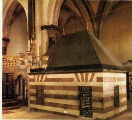
מצבת יצחק אבינו במערת המכפלה

המלכות מתחילה בחברון. בברכתו של יעקב אבינו לבנו יהודה (שבט המלכות), נאמר: "חכלילי עינים