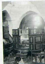
בית כנסת אברהם אבינו בחברון תרפ"ט