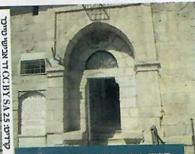
בית שנאורסון בחברון