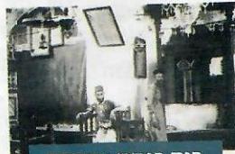
בית כנסת אברהם אבינו בחברון