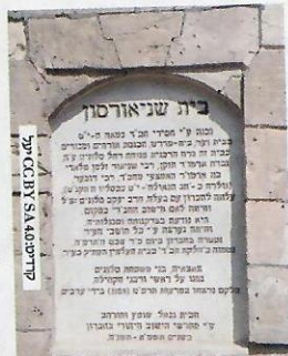
בית שנאורסון בחברון

בית הכנסת שוחזר על פי תמונות ועל פי זכרונות של בני חברון שניצלו בתרפ"ט, וכיום הוא שוב משמש לתפילה. לבית הכנסת הוחזרו ספרי תורה עתיקים שנלקחו ממנו לירושלים לאחר הטבח בתרפ"ט.