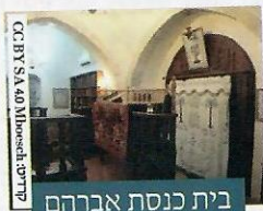
בית כנסת אברהם אבינו בחברון כיום