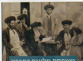
משפחת סלונים בחברון

הרבנית מנוחה רחל נפטרה בכ"ד בשבת ה'תרמ"ח , ונטמנה בבית העלמין העתיק בחברון. ציון קברה נהרס בידי ערבים אחרי פרעות תרפ"ט. מקומו זוהה על ידי פרופ' בן ציון טבגר, שבנה מחדש את תל האבנים מעל קברה.